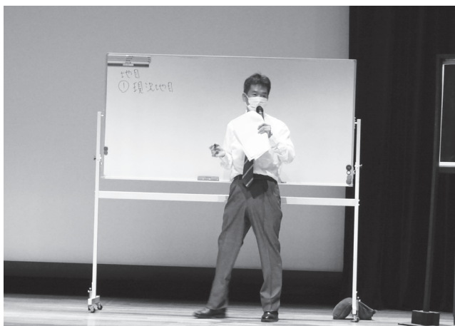
〔講師を務める関研修部長〕