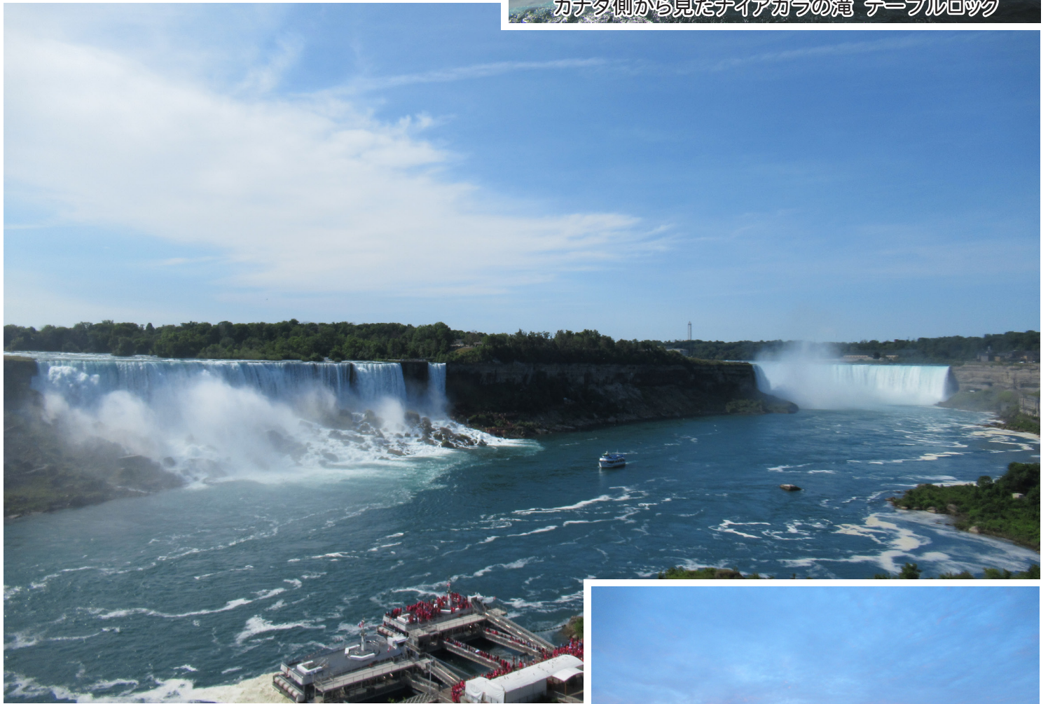
カナダ側から見たナイアガラの滝 クルーズ風景