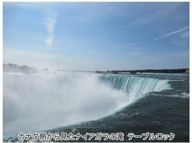
カナダ側から見たナイアガラの滝 テーブルロック