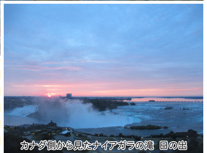
カナダ側から見たナイアガラの滝 目の出