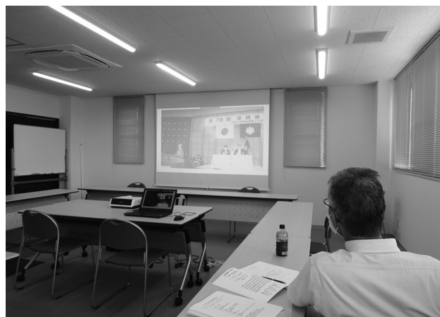
〔Live 配信を視聴する萩原会長〕