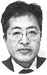
前橋地方法務局長