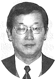
群馬土地家屋調査士会